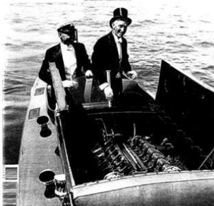
SCOPERTE DALL'AMERICA I PIANI SEGRETI DEI J CLASS - SCIARRELLI A RUOTA LIBERA IL RACCONTO DI UN GRANDE MAESTRO - NARVALIA 58 QUANDO IL CLASSICO E D'AVANGUARDIA - MOTONAUTICA DA GUINNESS UN SERVIZIO LUNGO 100 ANNI