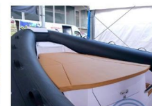
PRENDISOLE DI PRUA

I sedili per guidatore e copilota sono indipendenti e sono progettati per garantire un buon supporto laterale durante la navigazione in condizioni di mare agitato.