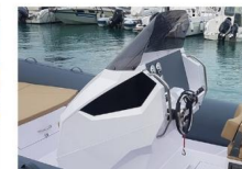
CONSOLLE DI GUIDA - VISTA LATERALE

La consolle di guida ha un ampio cruscotto per l'installazione della strumentazione motore, ampi schermi GPS, VHF, stereo, interruttori e molti altri controller.