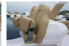
SEDILE DI GUIDA - DETTAGLI

Il doppio sedile reclinabile permette di guidare in piedi o da seduti, mantenendo sempre un'ottima visuale in navigazione.