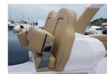
SEDILE DI GUIDA - DETTAGLI

Il doppio sedile reclinabile permette di guidare in piedi o da seduti, mantenendo sempre un'ottima visuale in navigazione.