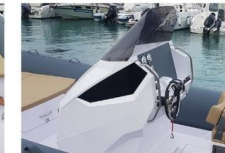
CONSOLLE DI GUIDA - VISTA LATERALE

La consolle di guida ha un ampio cruscotto per l'installazione della strumentazione motore, ampi schermi GPS, VHF, stereo, interruttori e molti altri controlli.