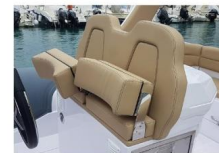
SEDILE DI GUIDA

La consolle ha una grande porta nella parte anteriore, con sedile integrato, che aprendosi rivela una zona bagno con wc con scarico elettrico.