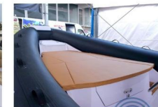
PRENDISOLE DI PRUA

I sedili per guidatore e copilota sono indipendenti e sono progettati per garantire un buon supporto laterale durante la navigazione in condizioni di mare agitato.