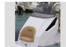
CONSOLLE DI GUIDA - VISTA FRONTALE

La vista laterale della consolle di guida mostra il design moderno e sofisticato che si adatta perfettamente alla funzionalità, offrendo spazio per un agevole passaggio verso prua.