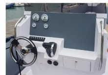
CONSOLLE DI GUIDA - CRUSCOTTO

La consolle di guida ha un ampio cruscotto per l'installazione della strumentazione motore, ampi schermi GPS, VHF, stereo, interruttori e molti altri controller.