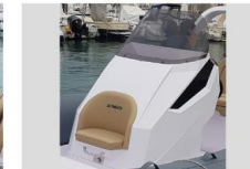
CONSOLLE DI GUIDA - VISTA FRONTALE

La vista laterale della consolle di guida mostra il design moderno e sofisticato che si adatta perfettamente alla funzionalità, offrendo spazio per un agevole passaggio verso prua.