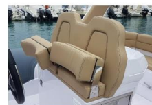
SEDILE DI GUIDA

La consolle ha una grande porta nella parte anteriore, con sedile integrato, che aprendosi rivela una zona bagno con wc con scarico elettrico.