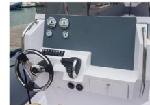
CONSOLLE DI GUIDA - CRUSCOTTO

La consolle di guida ha un ampio cruscotto per l'installazione della strumentazione motore, ampi schermi GPS, VHF, stereo, interruttori e molti altri controlli.